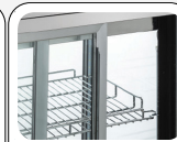
Porte scorrevoli posteriori